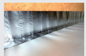
4. Anlegen und Liner einknicken