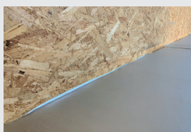
1. FDB SILVER SK anarbeiten

Zur Verklebung ist die unterseitige Schutzfolie des 23 cm-Streifens abzuziehen und blasenfrei anzudrücken. Dann folgt der 10 cm-Strei- fen zur Verklebung auf der Dampfsperre. FDB SILVER Connect darf nicht länger als zwei Wochen frei bewittert werden.