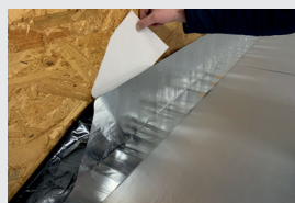
6. 23 cm-Liner abziehen