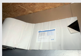
2. Liner vorbereiten